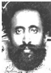
Emperador Haile Selassie I

El 16 de mayo de 1935 Hitler restablece el servicio militar obligatorio y forma un ejército de 36 divisiones. Justifica esta violación al Tratado de Versalles el hecho de que no se ha producido la limitación de armamentos, sino que, por el contrario, las grandes potencias han acrecentado su poder bélico y ampliado la duración del servicio militar (Francia). La reacción de Francia y Gran Bretaña a este anuncio se limita a protestas formales.